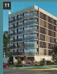
11 BE 525 SAN ISIDRO