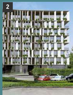
2 Naciones Unidas MIRAFLORES