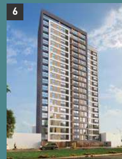
6 Urban Tower LIMA - PUEBLO LIBRE