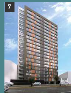
7 Family Tower BREÑA