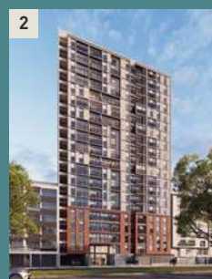
2 Supra Tower SAN MIGUEL