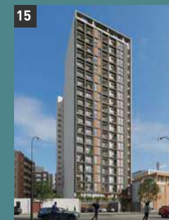
15 Family Tower 2 BREÑA