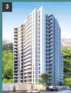
3 Park Tower SANTA BEATRÍZ