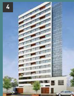
4 Neo Tower MAGDALENA