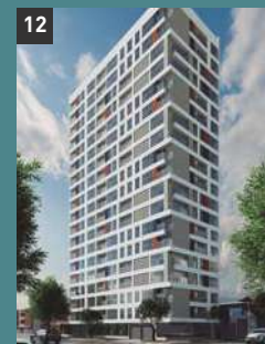
12 Living Tower SANTA BEATRÍZ