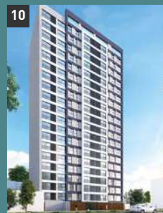
10 Urban Tower 2 LIMA - PUEBLO LIBRE