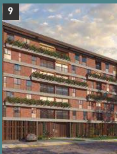
9 Way 3980 SAN ISIDRO