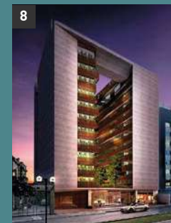
8 You 5020 MIRAFLORES