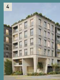
4 Bio 430 SURCO