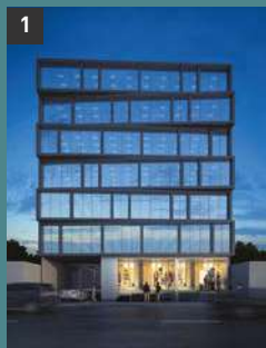
1 Ofis Tower MIRAFLORES