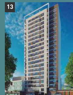
13 Dual Tower PUEBLO LIBRE