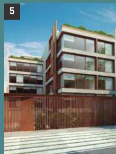
5 Romanet 179 SAN ISIDRO