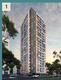
1 Cor Tower SANTA CATALINA